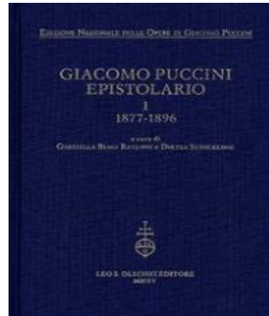
Epistolario de Puccini © Leo S. Olschki

La obra es editada por la Casa Editrice Leo S. Olschki y fue galardonada con el premio Illica 2015 al mejor trabajo publicado en Musicología.