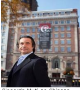
Riccardo Muti en Chicago