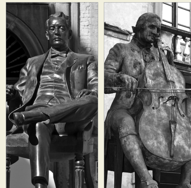
Monumento a Giacomo Puccini de Vito Tongiani (1994), plaza Cittadella, Lucca.

Casermetta San Colombano, Mura Urbane - 55100 Lucca, Italia