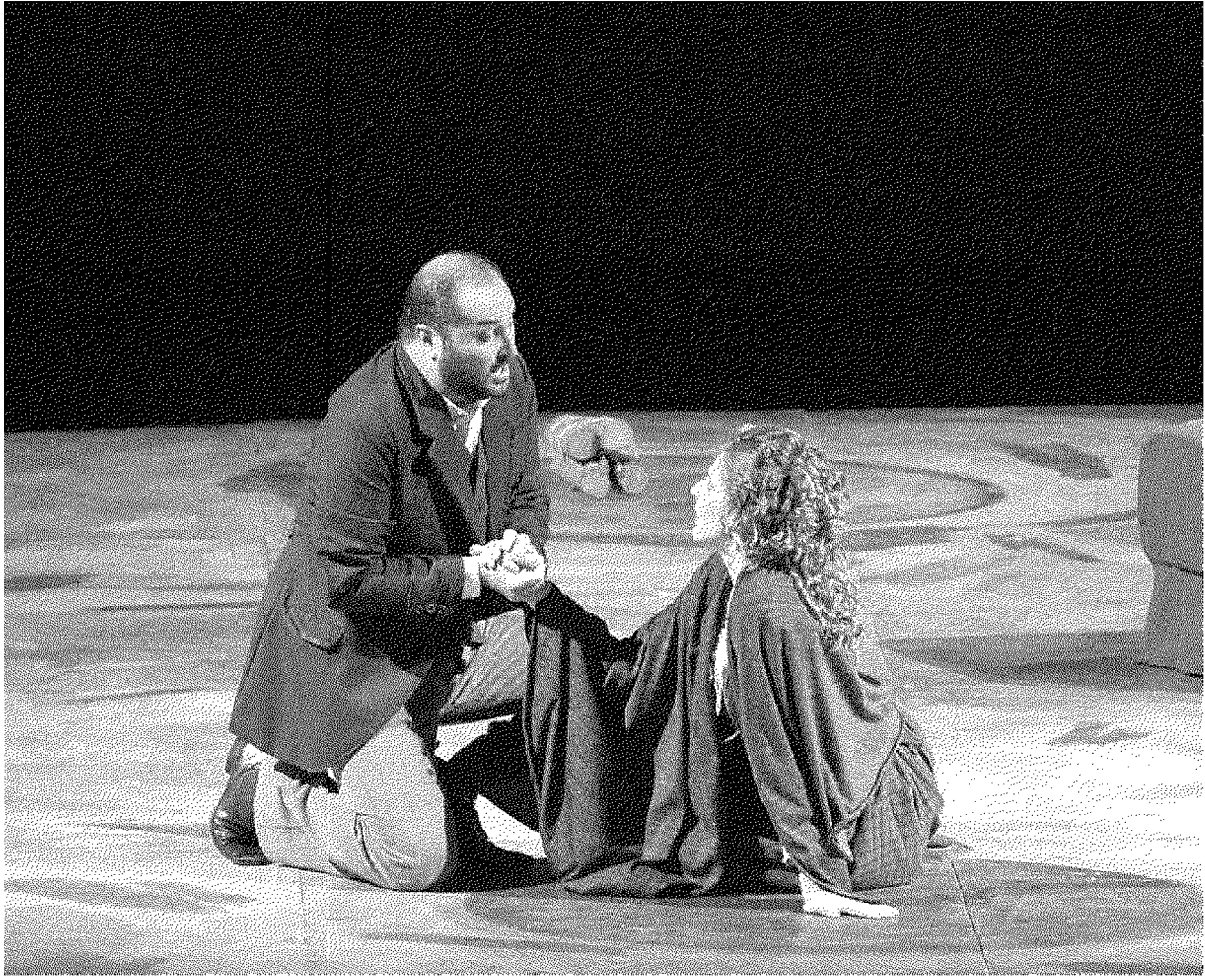
La Bohème di Puccini e sotto un'immagine del Maestro