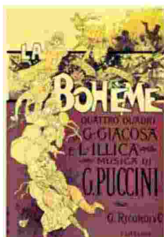
Le locandine Gli spettacoli di Puccini